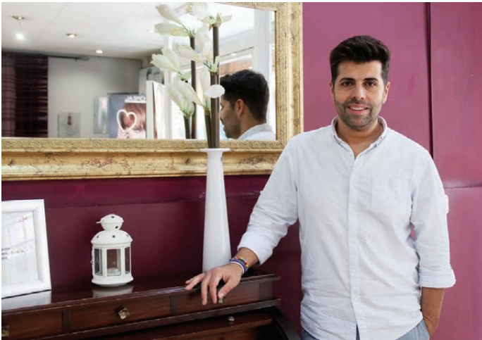
El perruquer vol el millor pel barri