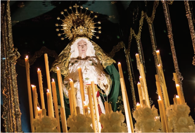
Nostra Senyora de l'Esperança, l'altra imatge de l'entitat