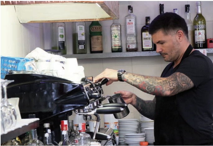
Són molts anys d'ofici rere la barra