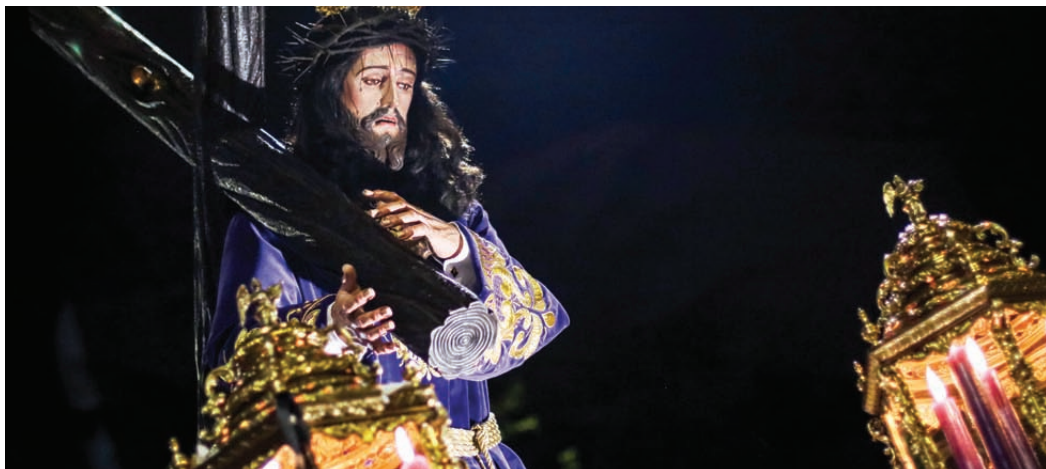
El 'Nazareno', conegut també com "El Señor de Cerdanyola", per Setmana Santa