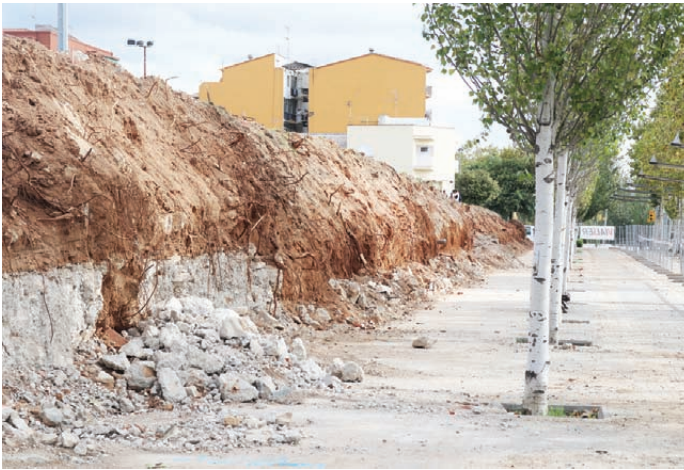
Els aiguats van enderrocar part del mur