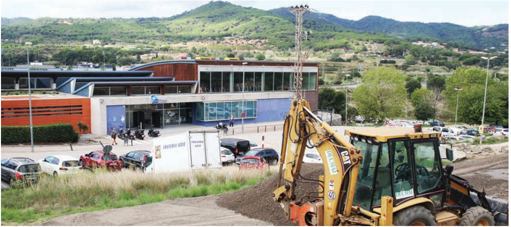
Les obres es fan per desenvolupar la zona adjacent a l'equipament esportiu