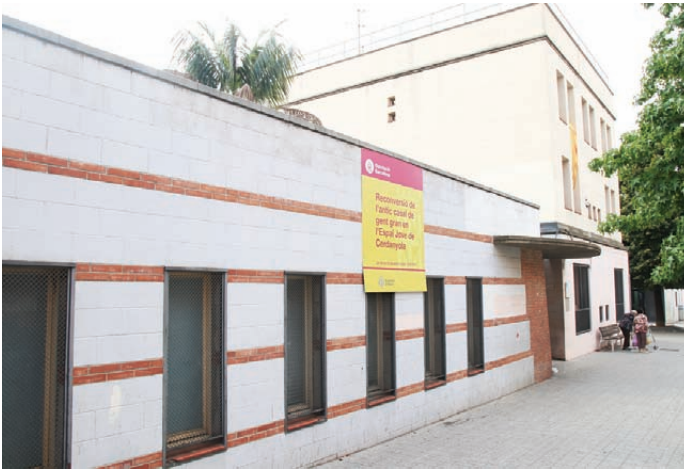
Les obres van amb retard i encara no s'han enllestit