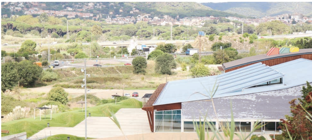
La zona del Sorral, vista des de darrera la piscina